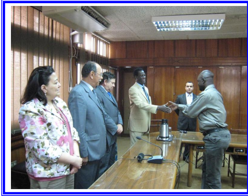
حفل دورة تنمية الثروة السمكية بالتعاون مع الصندوق المصري بالمركز المصري الدولي للزراعة

- "صحة الحيوان" لصالح 12 من الكوادر الافريقية من كل من : أوغندا/ السودان/ رواندا/ تشاد/ اريتريا/ اثيوبيا ، وذلك بالمركز المصري الدولي للزراعة في الفترة من 2011/12/18 الى 2012/1/5.