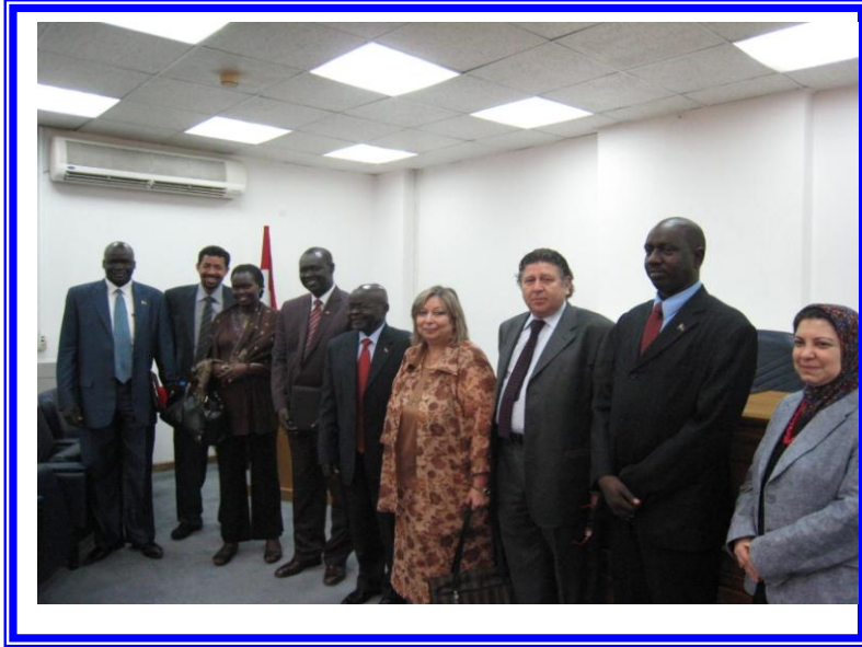
حفل دورة الدبلوماسية بالتعاون مع الصندوق المصري للتعاون الفني مع افريقيا بمعهد الدراسات الدبلوماسية بالقاهرة