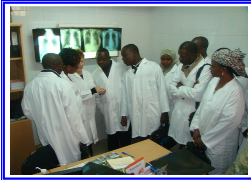
متدربي دورة السل بالمعهد الوطني للصحة العمومية بالجزائر

- دورة في مجال "التشخيص المجهرى لمقاومة الملاريا" وذلك لصالح 20 من الكوادر الافريقية من كل من : السنغال/ بوروندى/ تشاد/ النيجر/ الكونغو برازافيل/ توجو/ كوت ديفوار/ بنين/ مالي/ غينيا ، وذلك بالمعهد الوطني للصحة العمومية بالجزائر من 2011/12/25 الى 2012/1/12.