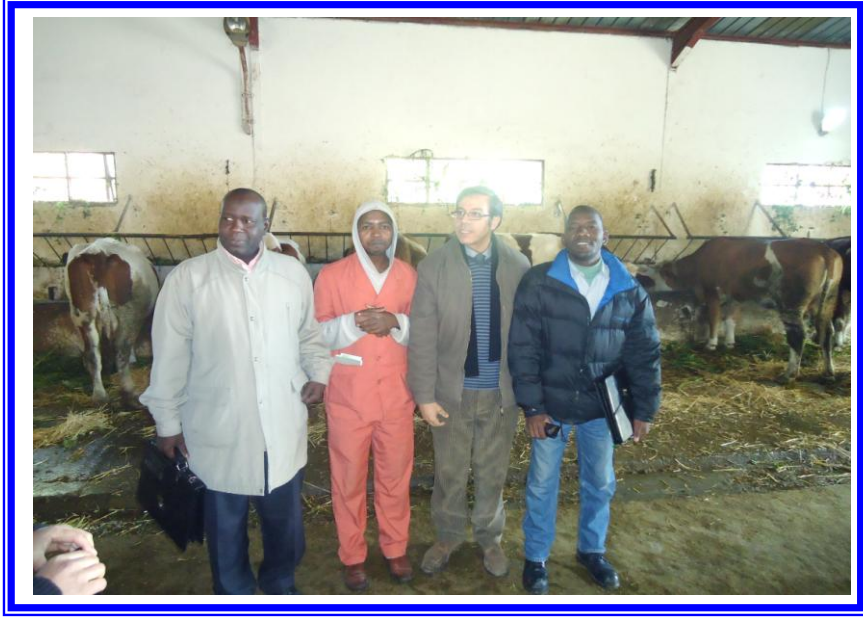
متدربى دورة التلقيح الاصطناعى للأبقار بوزارة الفلاحة والتنمية الريفية بالجزائر