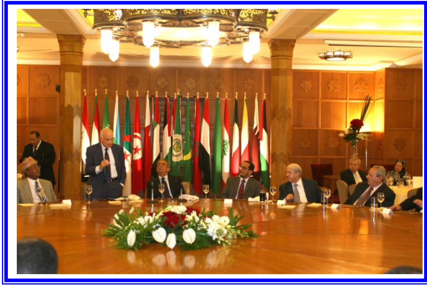
كلمة معالى الدكتور/ نبيل العربى الأمين العام الجديد للجامعة العربية فى حفل توديع معالى السيد/ عمرو موسى أمين عام الجامعة السابق

أقامت الأمانة العامة لجامعة الدول العربية يوم 2011/6/23 حفلاً حاشداً بالقاعة الكبرى بمقرها بالقاهرة لتوديع معالى السيد/ عمرو موسى قبيل مغادرة منصبه كأمين عام للجامعة، والترحيب بمعالى الدكتور/ نبيل العربى الأمين العام الجديد. وشارك فى الحفل الذى اتسم بالحرارة والمشاعر الفياضة لقيف من الأمناء العاميين المساعدين وموظفى الجامعة وأجهزتها ومؤسستها بما فيها الصندوق العربى للمعونة الفنية للدول الافريقية علاوة على المندوبين الدائمين للدول العربية، وحظى الحفل بحضور إعلامى مكثف. وقد ألقى السيد السفير/ أحمد بن حلى نائب الأمين العام كلمة مؤثرة أشاد فيها بدور وإنجازات السيد/ عمرو موسى وبأدائه المتميز فى خدمة أهداف الجامعة، طوال فترة ولايته على مدى نحو عشرة سنوات، وأنه أدار دفة العمل العربى المشترك بكفاءة عالية وسط عواصف هوجاء. وقد استعرض معالى السيد/ عمرو موسى جهوده خلال تولى منصبه للنهوض بالجامعة وتطوير آلياتها وتفعيل قراراتها ودعم قدراتها على تحقيق أهدافها فى خدمة القضايا العربية،