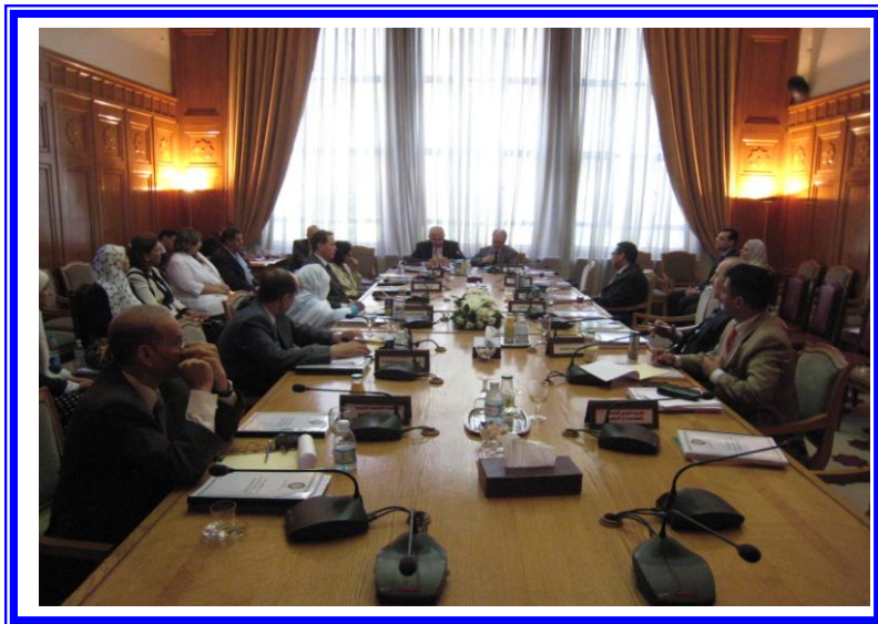
اجتماع السادة أعضاء مجلس الإدارة