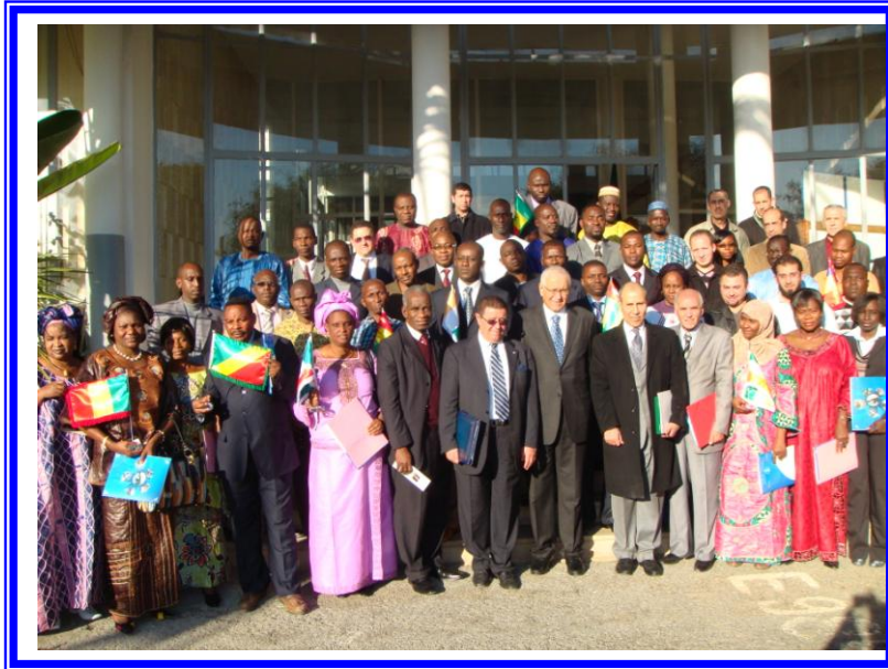
مشاركة السيد السفير مدير عام الصندوق فى حفل ختام دورتى السل والملاريا بالمعهد الوطنى للصحة العمومية بالجزائر