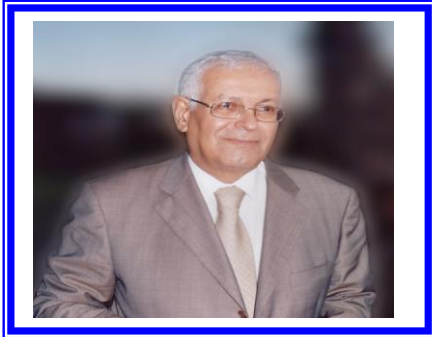
سعادة السفير/ عبد العزيز محمود بوهدمه الأمين العام المساعد لجامعة الدول العربية مدير عام الصندوق،