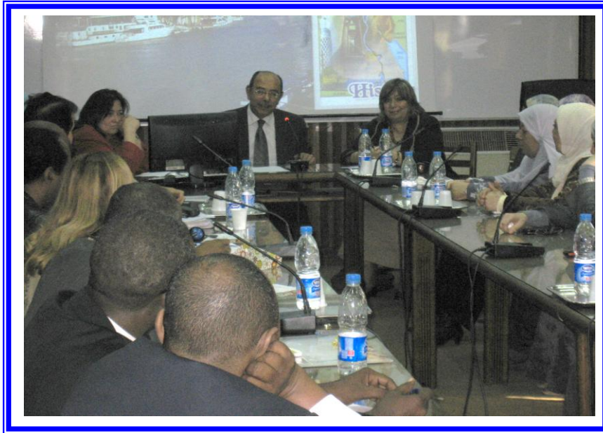
دورة صحة الحيوان بالتعاون مع الصندوق المصري بالمركز المصري الدولي للزراعة

- "صحة الحيوان" لصالح 12 من الكوادر الافريقية من كل من : أوغندا/ السودان/ رواندا/ تشاد/ اريتريا/ اثيوبيا ، وذلك بالمركز المصري الدولي للزراعة في الفترة من 2011/12/18 الى 2012/1/5.