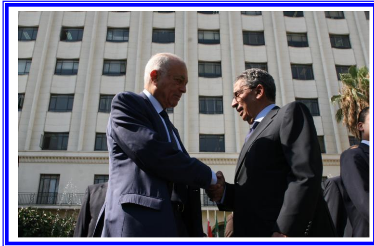
معالي السيد الدكتور/ نبيل العربي أمين عام الجامعة في وداع معالي السيد/ عمرو موسى أمين عام الجامعة السابق

كما أقام السفراء والمندوبون الدائمون العرب المعتمدون لدى الجامعة العربية حفلاً آخر بمقرها يوم 2011/7/3 بمناسبة تسليم وتسلم مهام الأمانة العامة رسمياً في نفس اليوم. وخلال هذا الحفل قدم السيد السفير/ عبد القادر الحجار سفير الجمهورية الجزائرية الديمقراطية الشعبية بالقاهرة نيابة عن المندوبين الدائمين درعاً إلى معالي السيد عمرو موسى. وأقام السيد السفير/ احمد عبد العزيز قطان المندوب الدائم للمملكة العربية السعودية بالقاهرة حفل غداءً لتكريم معالي السيد عمرو موسى والترحيب بمعالي الدكتور نبيل العربي الأمين العام الجديد.