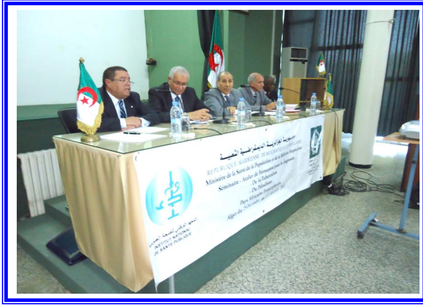
حفل اختتام دورتي السل والملاريا بالمعهد الوطني للصحة العمومية بالجزائر

- دورة في مجال "التشخيص المجهرى لمقاومة الملاريا" وذلك لصالح 20 من الكوادر الافريقية من كل من : السنغال/ بوروندى/ تشاد/ النيجر/ الكونغو برازافيل/ توجو/ كوت ديفوار/ بنين/ مالي/ غينيا ، وذلك بالمعهد الوطني للصحة العمومية بالجزائر من 2011/12/25 الى 2012/1/12.