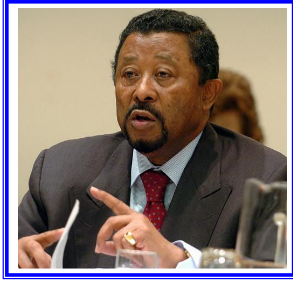
معالي السيد/ جون بانج رئيس مفوضية الاتحاد الإفريقي