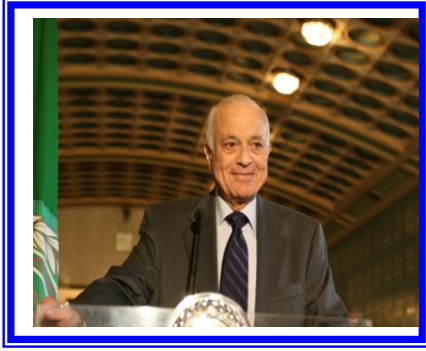
معالى الدكتور/ نبيل العربى أمين عام جامعة الدول العربية ومدير عام الصندوق