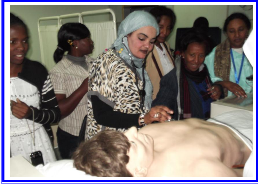
دورة صحة المرأة بالتعاون مع الصندوق المصرى – كلية التمريض – جامعة القاهرة