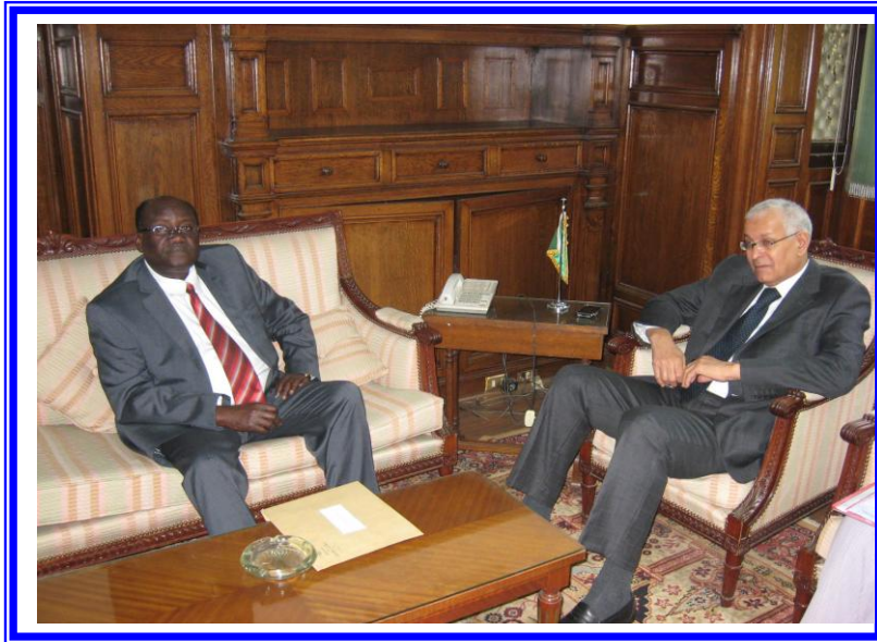
لقاء السيد السفير مدير عام الصندوق مع سعادة سفير جمهورية تشاد

- مقابلة السيد السفير/ محمد حبيب دوتوم سفير جمهورية تشاد بالقاهرة، بمقر الصندوق بتاريخ 2011/7/17