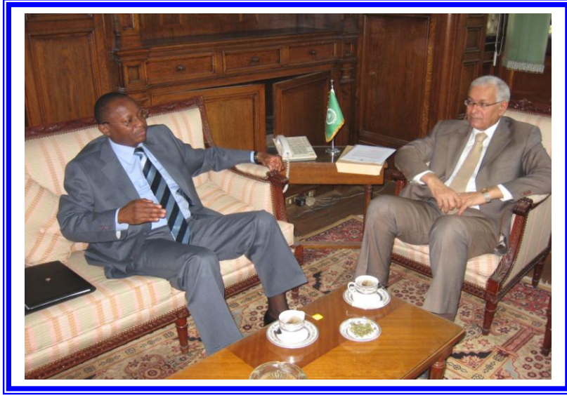
لقاء السيد السفير مدير عام الصندوق مع سعادة سفير جمهورية موزمبيق

- مقابلة السيد السفير/ جوزيه انطونيو ماتسينها سفير جمهورية موزمبيق بالقاهرة، بمقر الصندوق بتاريخ 2011/5/19