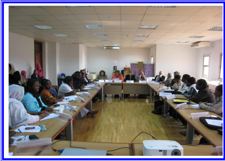
متدربى دورة تمريض صحة الام وحديثى الولادة بمركز التدريب والاستشارات البحثية- كلية التمريض - جامعة القاهرة