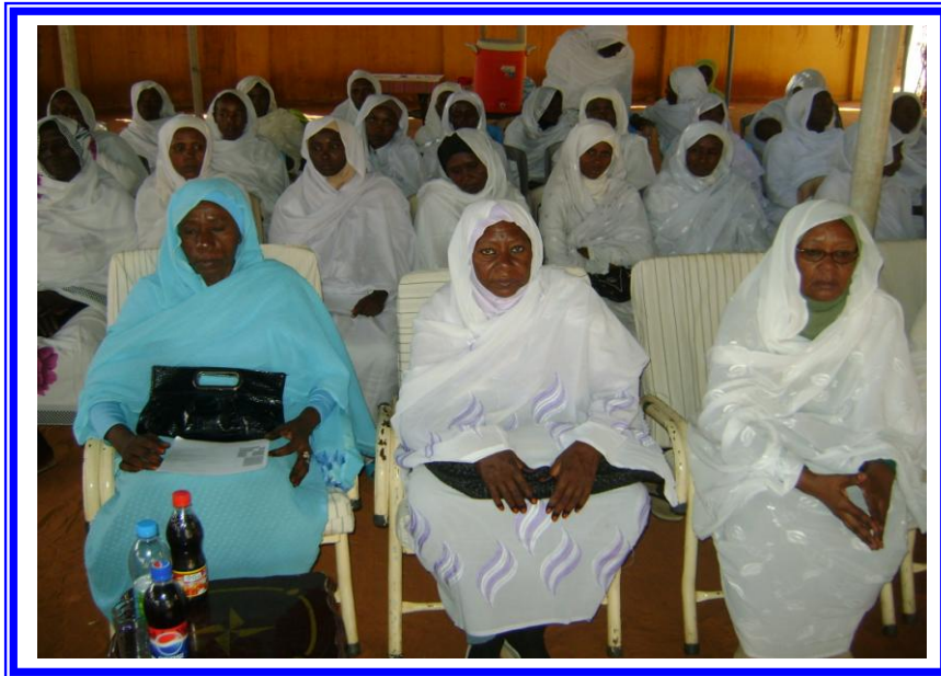
متدربي دورة تنشيط القابلات بشمال كردفان بالسودان