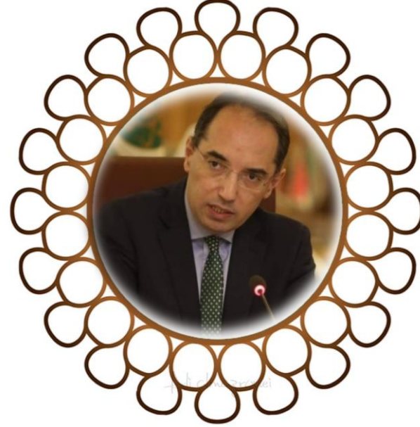
رئيس الجلسة سعادة/ منير الفاسي مدير إدارة حقوق الإنسان الأمانة العامة لجامعة الدول العربية