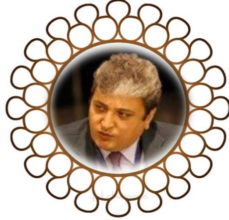
رئيس الجلسة سعادة/ علاء شلبي يس المنظمة العربية لحقوق الإنسان