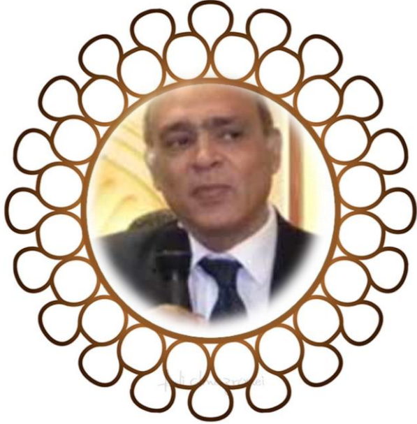
سعادة/ عماد الدين عدلي المنسق العام للشبكة العربية للبيئة والتنمية "رائد"