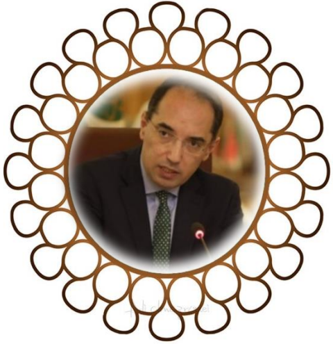
سعادة/ منير الفاسي مدير إدارة حقوق الإنسان الأمانة العامة لجامعة الدول العربية