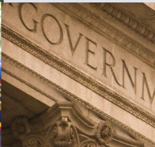
النهج الحكومي المتكامل