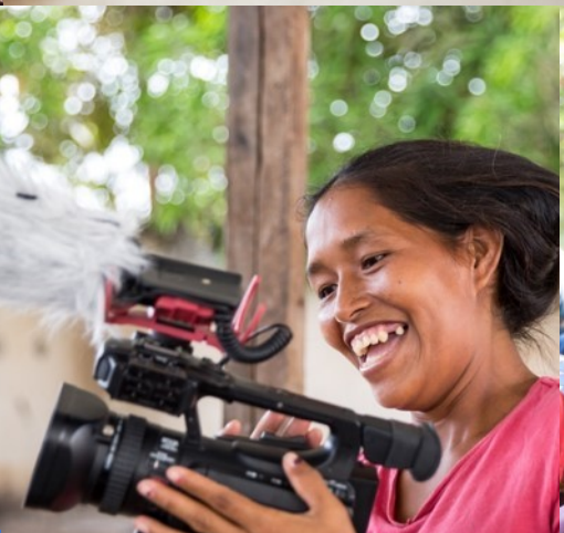
مراعاة النوع الاجتماعي