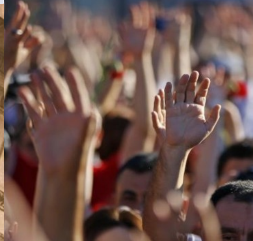
النهج المجتمعي المتكامل