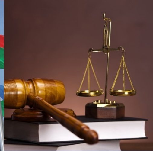
سيادة القانون والإجراءات القانونية الواجبة